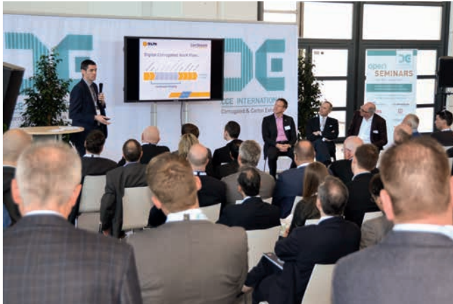
„Digitaldruck auf Wellpappe und auf Faltschachteln“ steht im Fokus der dreitägigen Offenen Seminare, die die CCE International 2017 – direkt innerhalb der Messehallen – begleiten