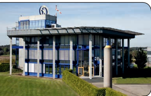
Unternehmensreportage: Schaber- klingen und mehr