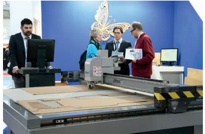
Mit Blick auf neue Anwendungen, wie Druck und Veredelung, zeigt die CCE International 2017, mit über 150 Ausstellern auf 5.000 m 2 , alles für die Wellpappen- und Faltschachtelindustrie

[ MESSEDUO ICE EUROPE UND CCE INTERNATIONAL 2017: ]