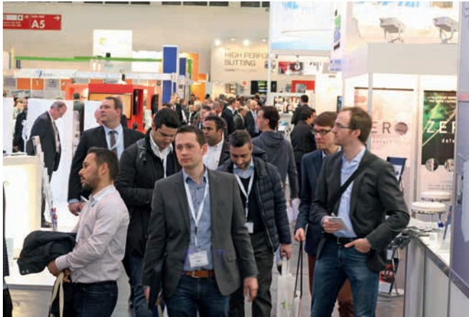
Mehr als 420 internationale Aussteller präsentieren während der ICE Europe 2017 neueste Converting-Technologien und -Lösungen auf über 11.000 m 2