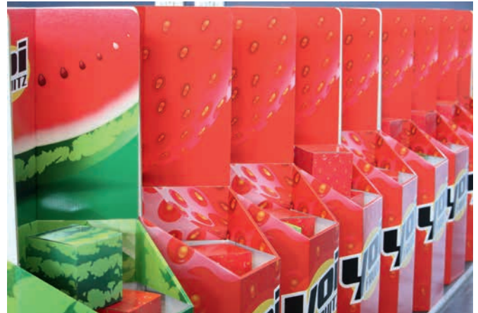
Moderne Werbedisplays oder luxuriöse Geschenkverpackungen – Besucher beider Messen erwartet die ganze Bandbreite kreativer Lösungen für Papierverarbeitung und -veredelung

ne Ehrung im Rahmen einer feierlichen Preisverleihung auf der Messe.