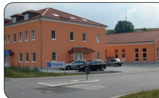
Frank-PTI bündelt Produktionskapazität